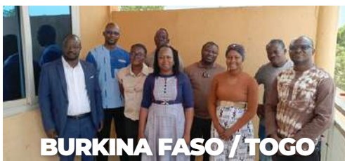
BURKINA FASO / TOGO