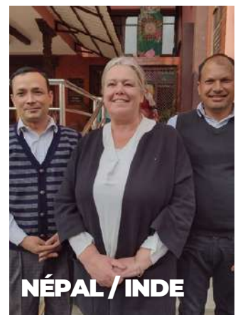
NÉPAL / INDE