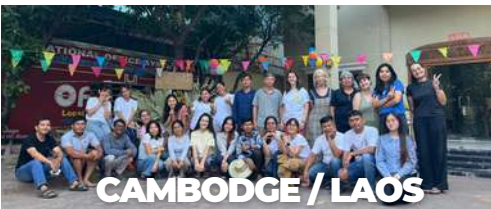
CAMBODGE / LAOS